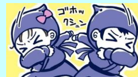
イラスト：青鹿ユウ

咳をする時、口元を手のひらで覆っていませんか？実はこれは、多くの人がしている誤った咳エチケット。咳の飛沫で出た菌やウイルスを手で受け止めると、そこから感染を広げてしまいます。園では、咳をする時は、右図のように、「忍者に変身！」スタイルなど、咳を腕で防ぐことを子ども達に勧めています。