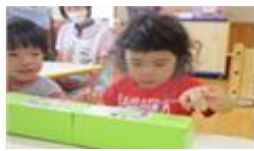
歯みがきの仕方もしっかり学びます。