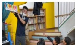
「早寝早起き」のお話をしました。